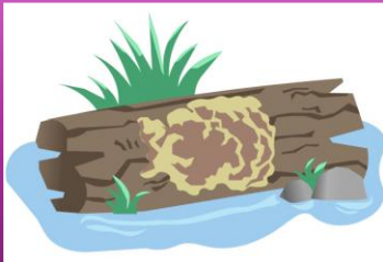
Falsa Cola de Pavo