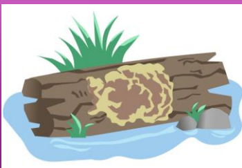
Falsa Cola de Pavo