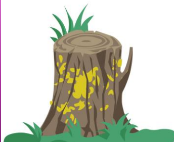
Liquen Polvo de Oro