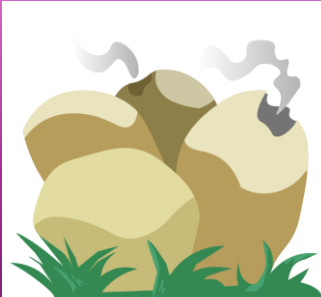
Hongo Pedo de Lobo