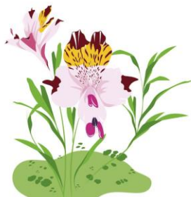
Flor del Águila